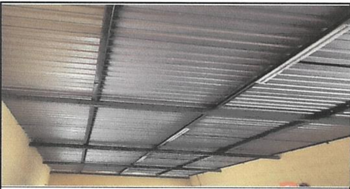
Foto 5: suministro e instalacion de cubierta metalica con costanera de 2x6 y cargador de lamina con costanera de 2x4 a 2 aguas mas laina troquelada alucin calibre 26 incluyendo tornillera y capote